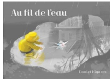
Au fil de l'eau Daniel Miyares Éd. Scholastic